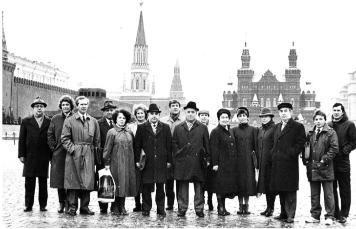
Ярославская делегация на 19 съезде профсоюзов.

23-27 октября того же года состоялся XIX съезд профсоюзов СССР. На этом съезде И.Е. Клочков выступил уже от имени всех профсоюзов России. Делегаты съезда приняли кардинальное решение, закрепившее и углубившее позитивные процессы, толчок к которым дали Учредительные съезды профсоюзов России.