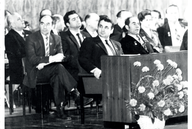
Президиум Учредительного съезда по созданию Российского профсоюза строительной отрасли.

даже выкрики с мест против его предложения.